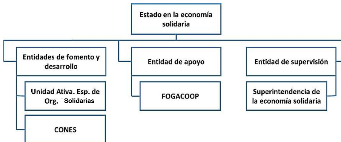
Gráfica 2: El Estado en el sector de la economía solidaria

indirectamente con el sector de la economía solidaria, en la siguiente gráfica se representan las principales entidades y otros esquemas que participan en el referido sector, desde el fomento y desarrollo, el apoyo y la supervisión.